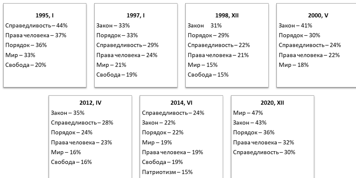
Рис. 1. Структура предпочтений респондентами основных понятий, которые могли бы лечь в основу политики возрождения России, 1995–2020 гг. 4 (РФ, % от числа опрошенных)

Рассмотрим, что отличает структуру ценностных социально-политических