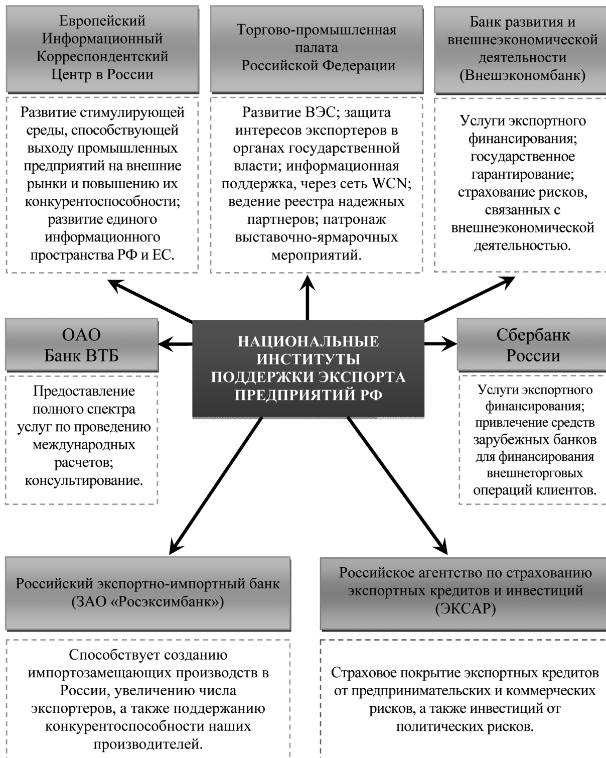
Рис. 2. Национальные институты, оказывающие поддержку Российским экспортерам промышленной продукции

ятий могло бы стать создание Единого координирующего органа экспортной поддержки (ЕКОЭП) — специализированного посреднического института между национальными экспортерами и зарубежными импортерами.