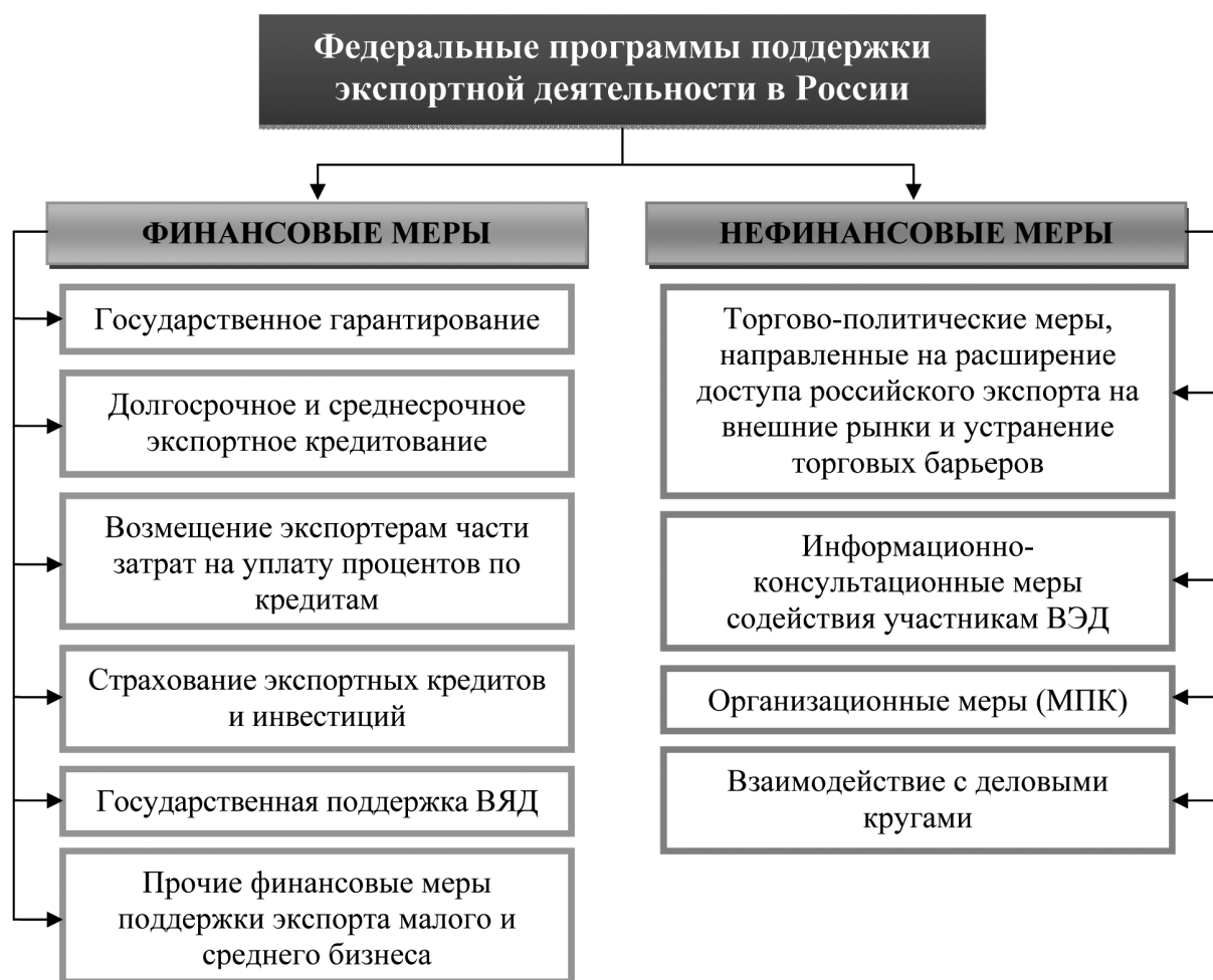
Рис. 1. Федеральные программы поддержки экспорта [3]

Одним из последних было образовано Российское агентство по страхованию экспортных кредитов и инвестиций (ЭКСАР), начавшее свою деятельность с октября 2011 г.