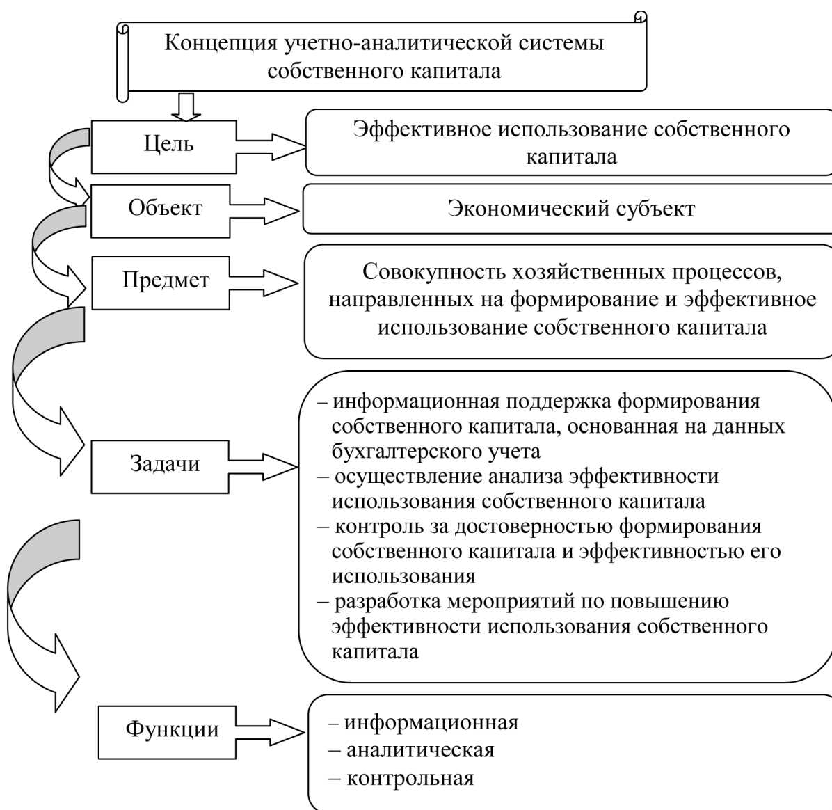
Рис. 1. Концепция учетно-аналитической системы собственного капитала предприятия

Таким образом, обобщая полученные в ходе исследования данные, под учетно-аналитической системой понимают комплекс взаимосвязанных функциональных подсистем (элементов), обеспечивающих непрерывный сбор, систематизацию, обработку и последующую оценку информации, формируемой бухгалтерским учетом для проведения анализа эффективности деятельности экономического субъекта и аудита, подтверждающего достоверность предоставляемой его системой учета информации для принятия адекватных управленческих решений [1].