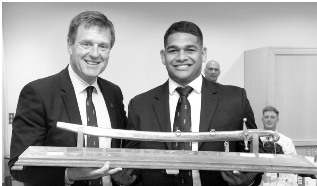
Рис. 4. Адмирал Бен Кей вручает победителю казачью шашку

зоде «резни в Хотке» 5 июня 1855 г., что не удивляет — русские «зверски» расстреляли не беззащитных английских моряков (с несколькими пленными финнами, взятыми в качестве «живого щита») с белым флагом, но военных, выполнявших боевую разведывательную задачу по промеру глубин, а результат боестолкновения стал объектом гибридной войны.