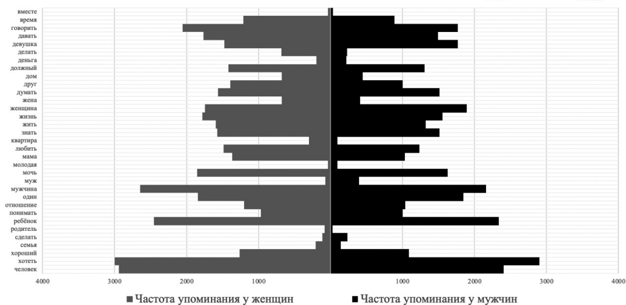
Рис. 3. Сравнение w- и m-нарративов Fig. 3. Comparison of w- and m-narratives