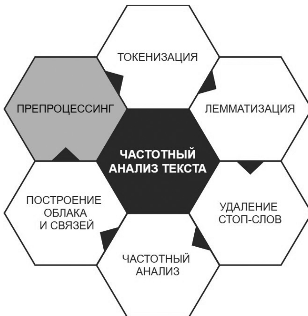
Рис. 1. Алгоритм частотного анализ текста Fig. 1. The algorithm of frequency analysis of the text

2. Токенизация текста. Для последующей обработки очищенный текст необходимо раз-