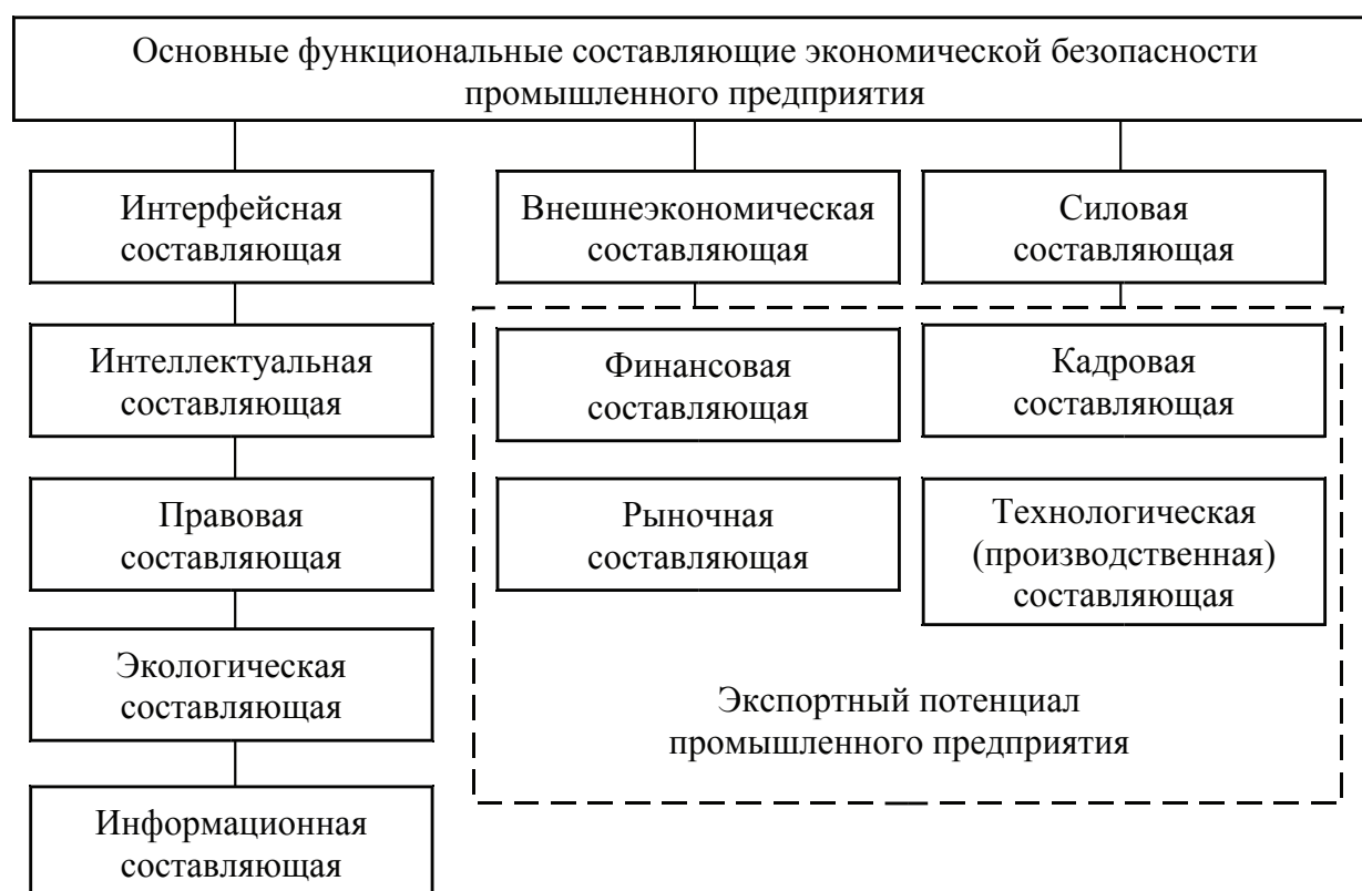
Рис. 3. Экспортный потенциал в структуре экономической безопасности промышленного предприятия