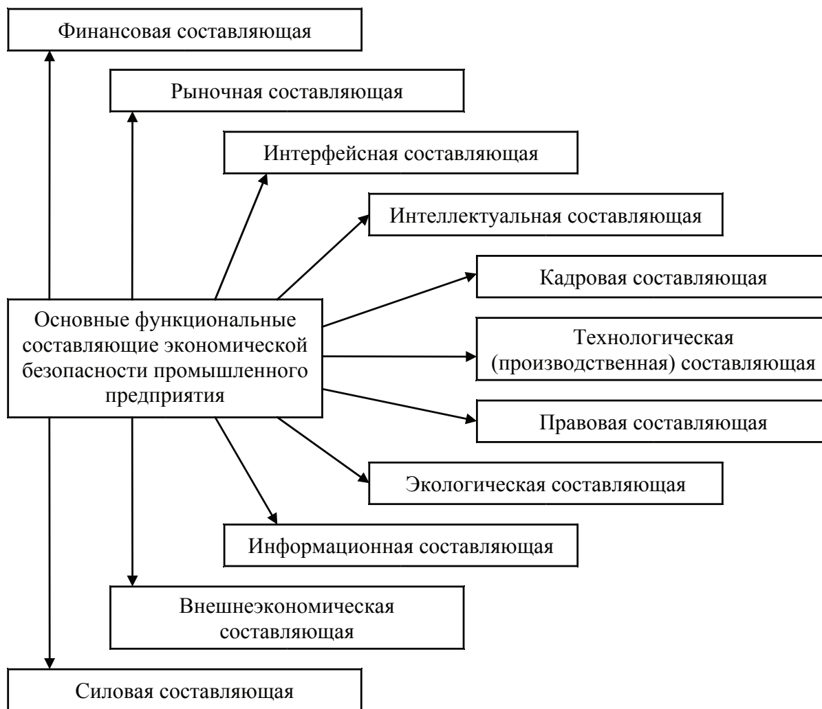
Рис. 1. Основные функциональные составляющие экономической безопасности промышленного предприятия

безопасность и экспортный потенциал. Однако компоненты экспортного потенциала являются составляющими экономической безопасности, поэтому целесообразно рассматривать экспортный потенциал как один из факторов обеспечения экономической безопасности. Одновременно на данный момент остаются недостаточно рассмотренными вопросы определения связей и влияния экспорта на обеспечение экономической безопасности, что подтверждает актуальность темы.