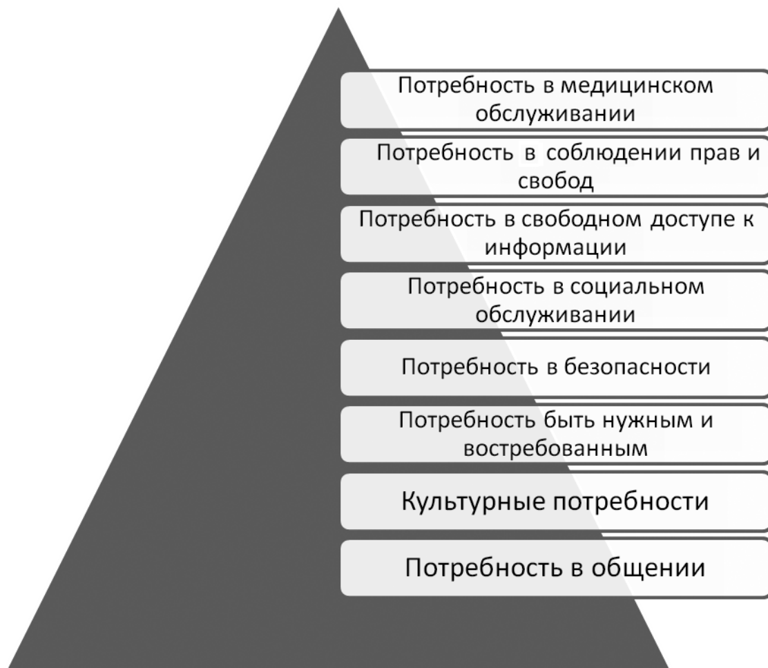
Рис. 2. Пирамида удовлетворенности потребностей людей

твом респонденты считают возможность производить собственные продукты питания (16%). Спокойствие, тишина и удаленность от суеты крупных городов являются огромным преимуществом для многих людей, проживающих в сельской местности (13%). Но более 50% всех респондентов полагают, что культурный уровень сельских жителей ниже, нежели у жителей городских территорий.