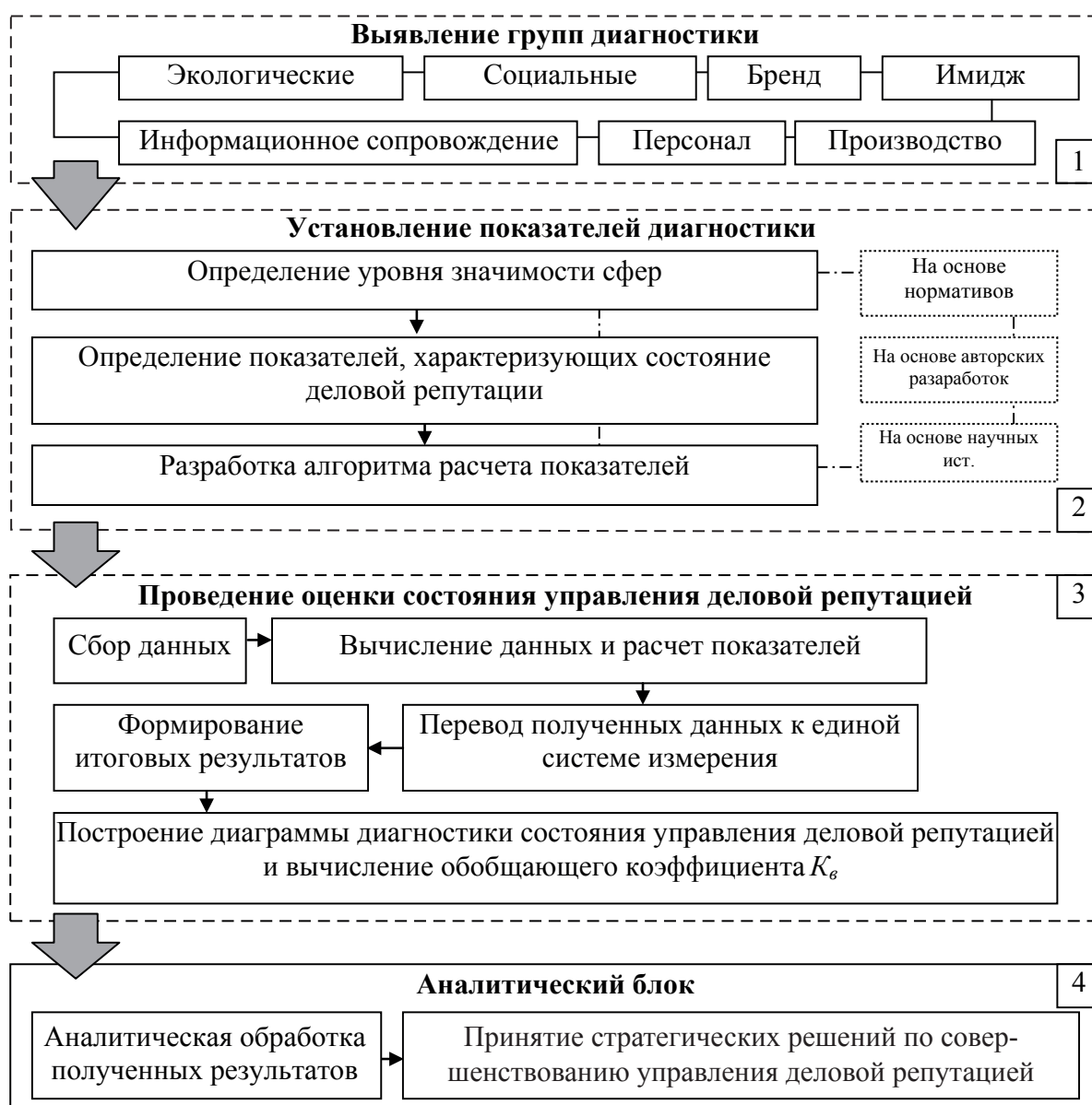
Рис. 3. Последовательность проведения диагностики состояния управления деловой репутацией на предприятии