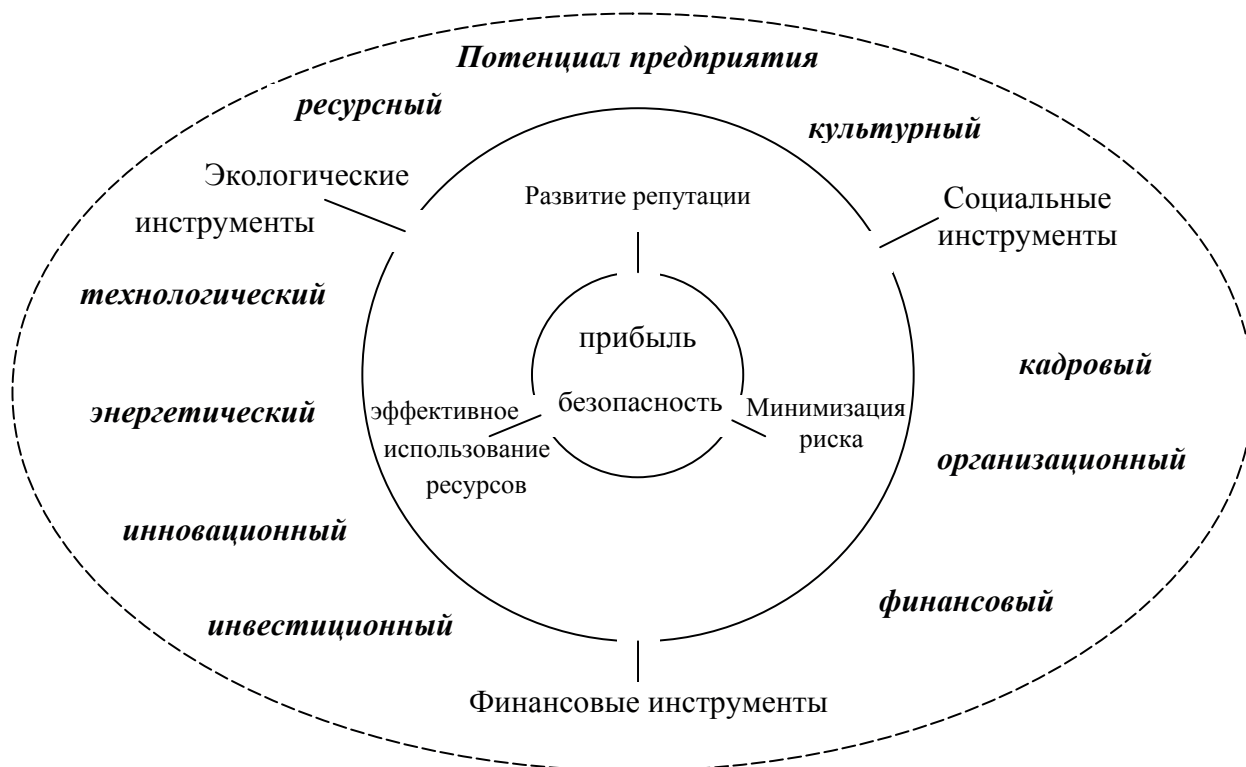
Рис. 1. Место деловой репутации в прибыльности предприятия

ет ключевое место в формировании экономической безопасности и прибыльности предприятия [1; 2]. Это подтверждается многими исследованиями и практической деятельностью предприятий [4; 6]. На рис. 1 приведено место деловой репутации в достижении главной цели — прибыльности и экономической безопасности предприятия, в структуре его потенциала.